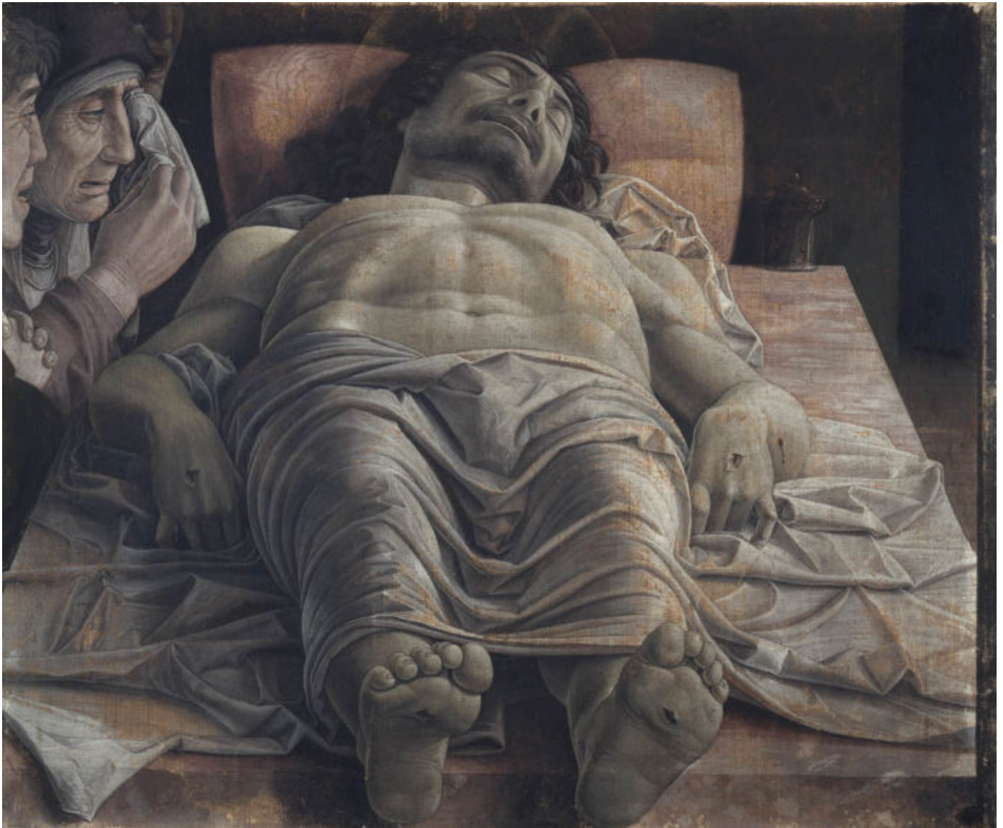
Andrea Mantegna, Cristo morto nel sepolcro e tre dolenti , 1470-1474, Milano Pinacoteca Brera